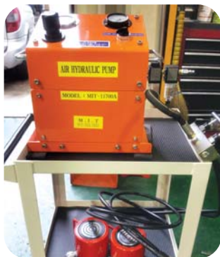
(철심장입용 35Ton 유지) (2Point 동시 작업)