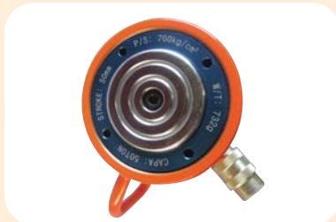
50Ton, 50S/T 무게 7.3kg