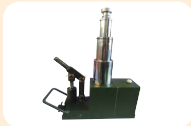
3단 유압잭 250S/T