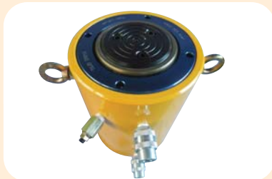
200Ton, 150S/T(복동) 무게 58kg