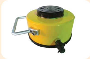
알루미늄 유압잭 200Ton, S/T30M/M (2000Bar사용, 12kg)