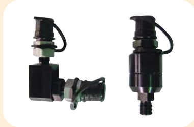
스위벨카플러 (2500Bar, 1500Bar)